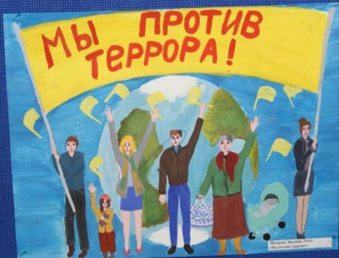
Иллюстрация: Александр Сидоров "Мы против террора"